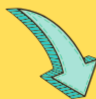
Borang Slip Wang Tunai Masuk